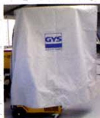
Capa de proteção Ref. 050853